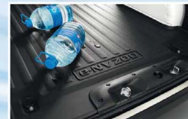
Protezione in plastica per pianale (43) e protezione soglia bagagliaio (11)