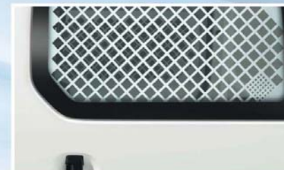
*Non disponibile in Svizzera. Griglia di protezione per porta scorrevole (48)