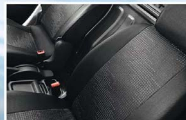
Rivestimento sedili in tessuto ecologico (10)