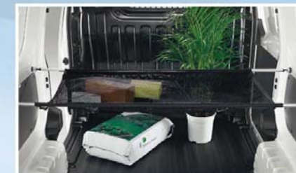
Sistema di barre per rete fermacarichi (27)