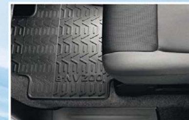
Battitacco (09) e tappetino in gomma (28)